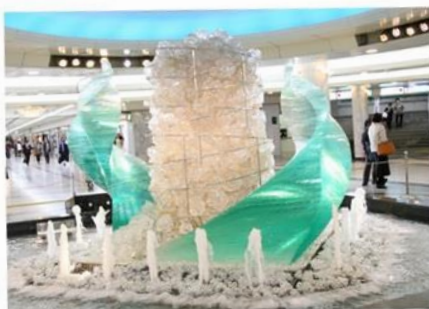
現在のクリスタル広場

栄地下センターは、サカエチカ開業の昭和44年11月に初代『クリスタルオブジェ』『シャトールクリスタル』を設置し、平成11年の30周年から現在のオブジェを展示しています。また撤去後は、植物や歳時記に添った装飾等を期間限定で展示し、その後平成30年春頃にはイベントスペースとして活用致します。