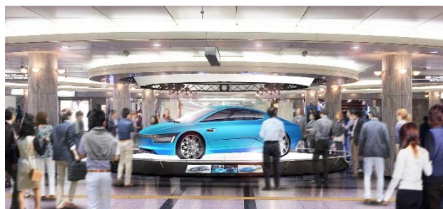
撤去後のクリスタル広場イメージ